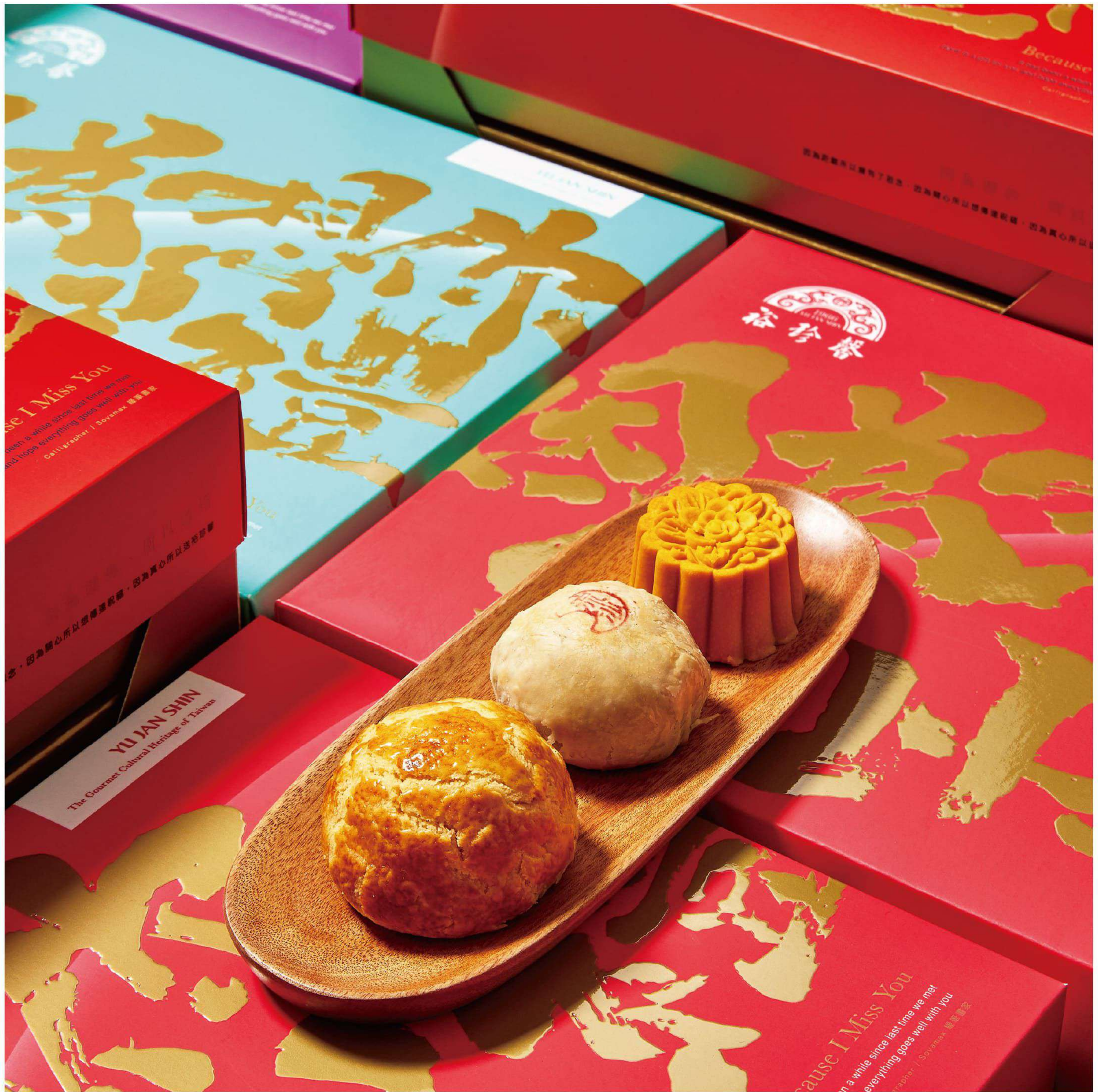
It has been a while since last time we met. Here is a gift for you and hope everything goes well with you.