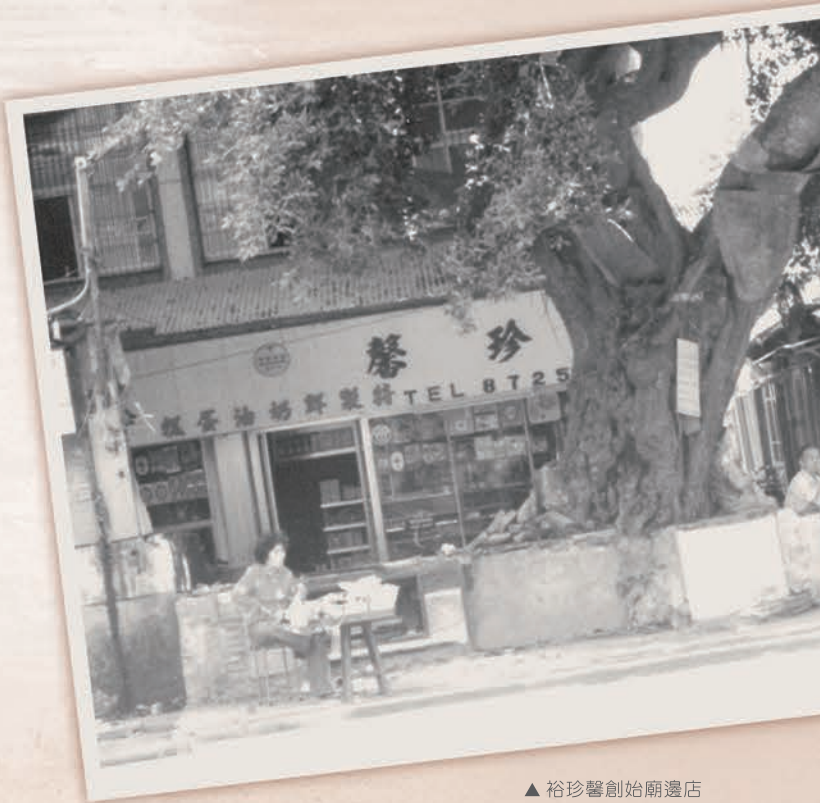
▲ 裕珍馨創始廟邊店