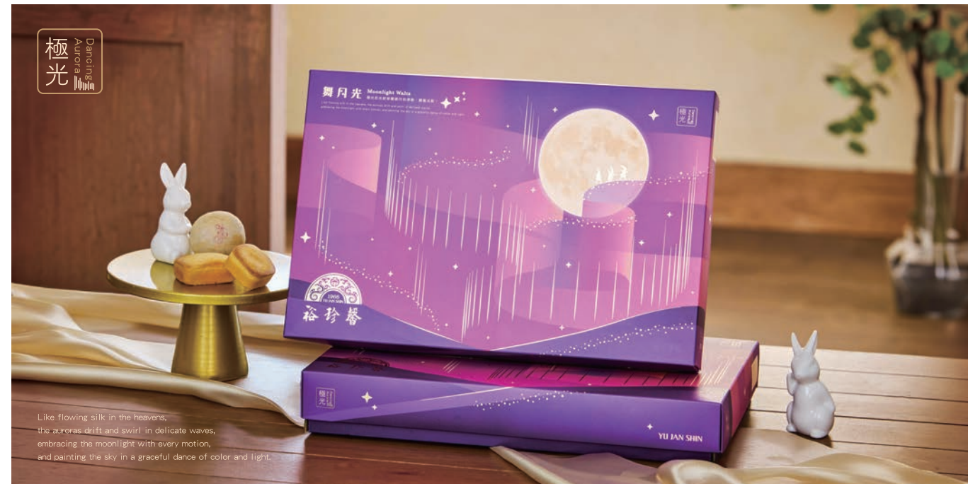
極光禮盒 禮盒尺寸：L38×W25×H5.7cm