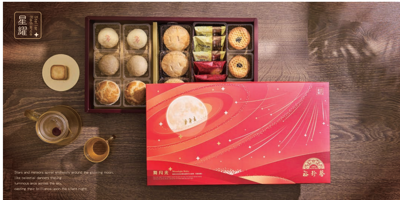
星耀禮盒 禮盒尺寸：L45.7×W25×H5.7cm